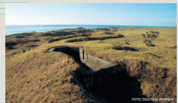
Ørnakulå på Kvalbein har fleire synlege spor etter tyskaranes forsvarsanlegg, mellom anna kanonstillingar og skyttergraver.

bekken. Det sørlegaste, som ligg ved fyret, har ca. 40 haugar og 3 hustufter, det nordlegaste ca. 70 haugar. Felta er blant dei største og best kjende i Noreg. Dei vart undersøkte alt i 1891-1898. Lenger sør, ved Fuglavigjå, er det fleire naust-tufter, tarela og båtopptrekk. På 1800-talet vart det bygd ein redningsstasjon på Raunen og ved Kvalbeinsanden. Ved Ørnakulå og sørover er det tydelege spor frå tyske krigsanlegg. Lengst i sør, ved Holmastø, er det eit gammalt og intakt naustmiljø.