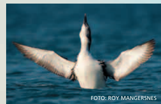
Islom overvintrar langs jærkysten. Arten hekkar i arktiske strøk.