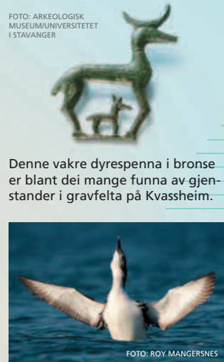
Denne vakre dyrespenna i bronse er blant dei mange funna av gjenstander i gravfelta på Kvasseim.