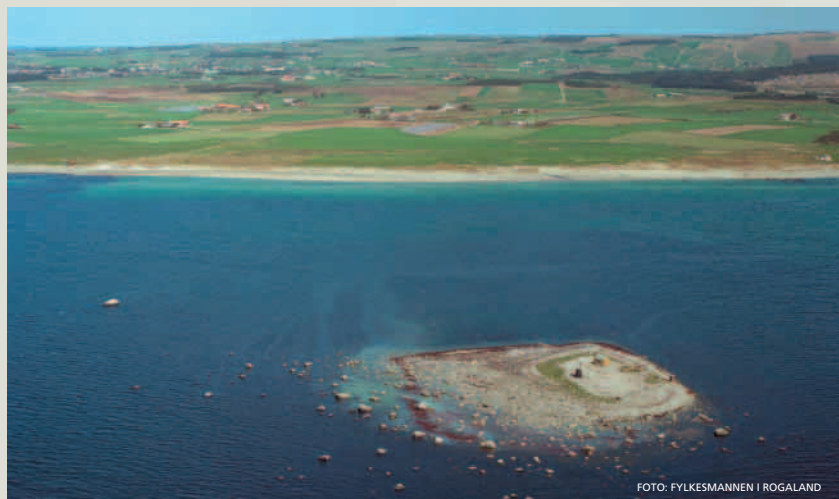
Raunen stikk opp av sjøen utanfor stranda på Kvalbein. Holmen er ein del av Listamorenen som strekk seg heilt nord til Revtangen.